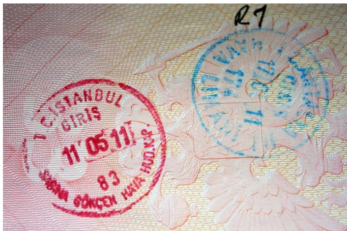
Образец штампа при въезде в Турцию в целях туризма и бизнеса

Гражданам Таджикистана желающие посетить Турцию, настоятельно рекомендуется ознакомиться с информацией о турецких визах и визовом режиме в целом до того, как они решат въехать в страну.