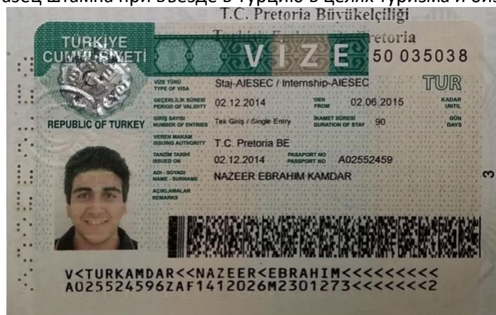
Образец визы в Турцию при других обстоятельствах