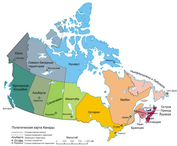
Рисунок 1. Расположение Канады на карте