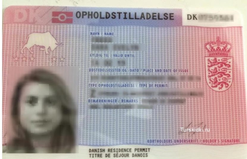
Рисунок 3. Пример пластиковой карты вида на жительство в Дании

Вид на жительство необходимо иметь тем, кто приезжает в Данию с целью трудоустройства, долгосрочного обучения, стажировки, воссоединения семьи и участия в программе Au Pair. Для трудоустройства и прохождения стажировки потребуется дополнительно разрешение на работу.