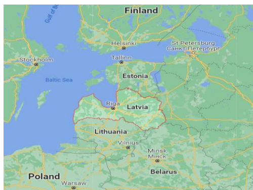
Рисунок 1. Расположение Латвии на карте

Государственным языком Латвии является латышский язык. Это один из нескольких восточнобалтийских диалектов, который сохранился до наших дней и относится к старейшим европейским языкам. В восточной части Латвии распространён латгальский язык. Широко используется также русский язык, которым владеет значительная часть населения. (его понимает 80% жителей Латвии). Все объявления, вывески, названия улиц, расписание и остановки общественного транспорта, различные надписи выполнены исключительно на латышском языке.