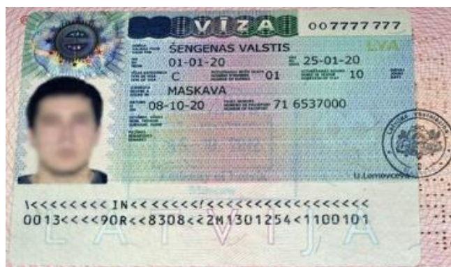
Рисунок 4. Пример Шенгенской визы категории C

Важно!!! Долгосрочные визы имеют категорию «D» (национальные). Их получение возможно только в исключительных случаях, при этом процесс получения ничем не отличается от оформления шенгенских виз типа «С».