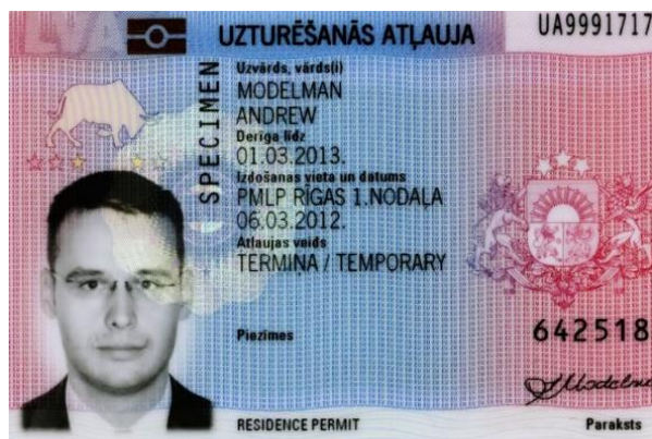
Рисунок 3. Пример пластиковой карты вида на жительство в Латвии

Вид на жительство необходимо иметь тем, кто приезжает в Латвии с целью трудоустройства, долгосрочного обучения, стажировки, воссоединения семьи и участия в программе Au Pair. Для трудоустройства и прохождения стажировки потребуются дополнительно разрешение на работу.