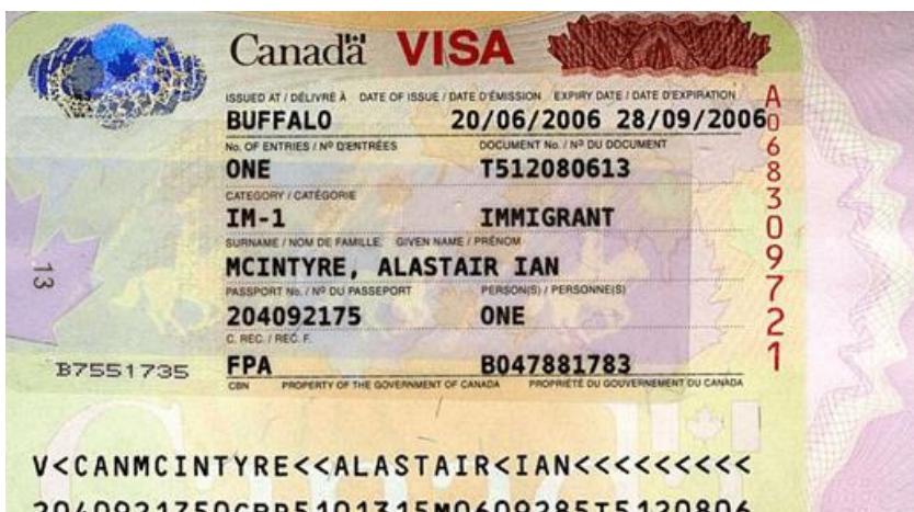
Расми 4. Намунаи раводид ба муҳоҷират

Барои гирифтани маълумоти бештар дар бораи муҳоҷират ба Канада дар доираи барномаи Экспресс-вуруд, лутфан аз ин истинод истифода баред: https://www.canada.ca/en/immigration-refugees-citizenship/services/come-canada-tool-immigration-express-entry.html