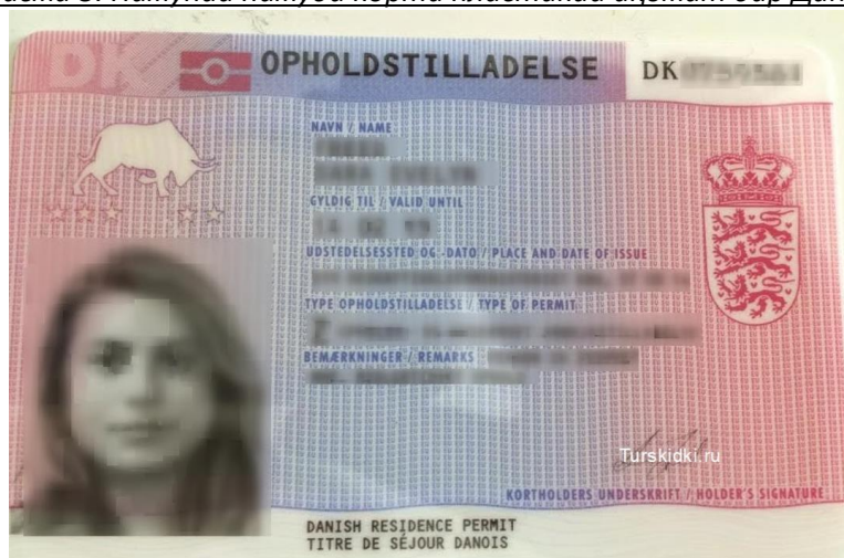
Расми 3. Намунаи намуди корти пластикии иқомат дар Дания

Шахсоне бо мақсади кор, таҳсили дарозмуддат, таҷрибаомӯзӣ, пайвастшавии оила ва иштирок дар барномаи Au Pair ба Дания меоянд бояд корти истиқоматӣ дошта бошанд. Барои кор ва таҷрибаомӯзӣ иҷозати иловагии корӣ лозим аст.