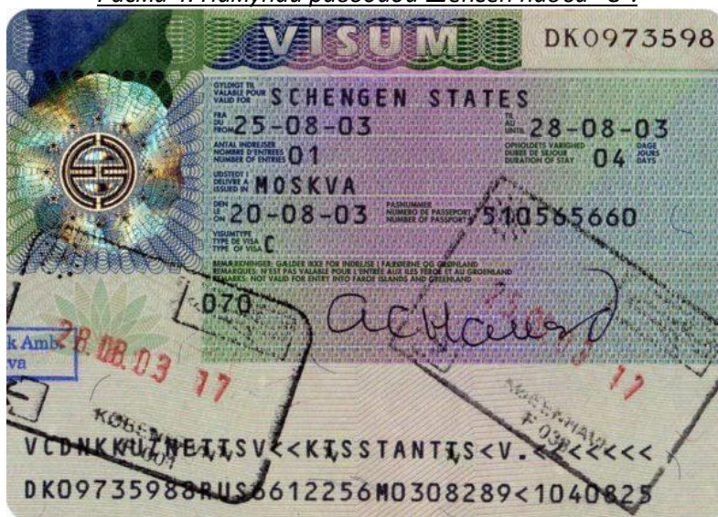
Расми 4. Намунаи равонди Шенген навъи “C”.

Муҳим!!! Раводидҳои дарозмуддат навъи “D” (миллӣ) мебошанд. Гирифтани онҳо танҳо дар ҳолатҳои истисноӣ имконпазир аст, ки дар қараёни он раванди гирифтани чунин раводид аз раванди Шенгени навъи “C” фарқ надорад.